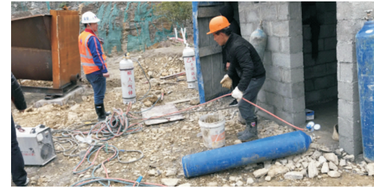
本报讯 为了预防各类安全事故的发生,切实保障企业安全生产,继续深化“消除事故隐患,筑牢安全防线”,2020年12月,矿业公司开展为期一个月的安全“回头看,抓落实”主题活动,活动分部门自查、组织检查、重点抽查三大部分实施,其目的是发动全体员工进行自查,提高员工安全意识和责任意识,还对历次检查到的安全隐患进行再次重点检查,强化安全管理和安全责任抓落实。