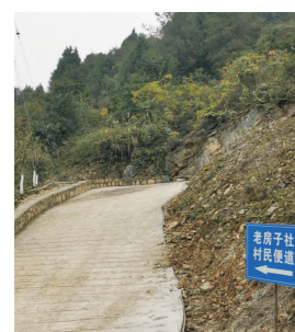
本报讯 重庆市巴南区姜家镇老房子社的路原来是一条土路,晴天时尘土飞扬,雨天时泥泞难行,给当地村民出行带来极大困扰。了解这一状况后,巨成矿业自愿出资把该路铺设成水泥路,彻底解决了村民日常出行难的问题,得到了当地百姓的赞誉,体现了巨成公司造福百姓、回报社会的责任担当。