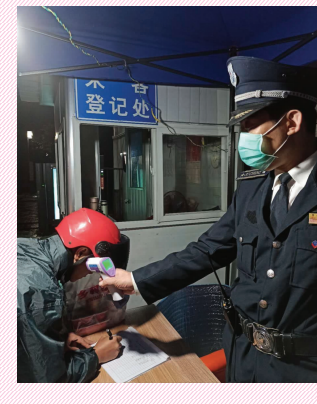
本报讯 针对近期我国本土出现新冠肺炎零星散发和局部聚集性疫情交织叠加的态势,巨成物业管理公司全力做好疫情防控,对外来进入小区的人员实行体温检测并做好登记;工作人员上门及广播提示小区居住人员做到“不扎堆、少聚集、戴口罩、勤洗手、多通风”,保持良好的生活卫生习惯。