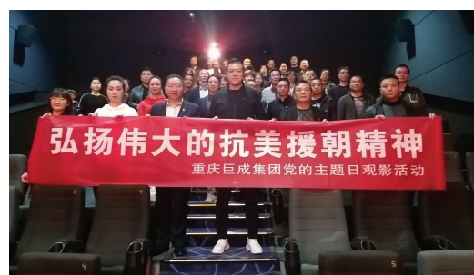
通过观看《金刚川》影片,使党员和职工受到了爱国主义精神、革命英雄主义精神的洗礼。深刻体会到志愿军视死如归、铁血疆场,坚决打败帝国主义的伟大抗美援朝精神。