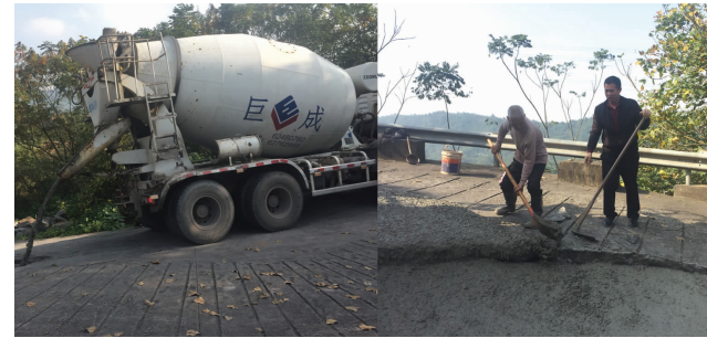
本报讯 2020年11月19日一早,混凝土公司行政部接到荷家嘴村村委的求助电话……原来,村里的道路由于年久失修,很多地方已经塌陷,最近阴雨连绵,造成道路积水严重,存的安全隐患,请求公司帮忙解决这个问题。接到电话后行政部立即报告给总经理唐先荣,唐总马上安排生产和运输部进行跟踪处理,争取当天完成道路浇筑硬化。