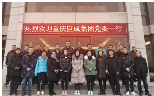
本报讯 为了弘扬伟大的爱国主义精神,增强全体党员的爱国热情,集团党委组织全体党员分批次前往山东省枣庄市参观学习。党员同志们参观了山东台儿庄大战纪念馆,在讲解员的引领下,详细了解了台儿庄战役起止情况,中国军民与日本侵略者之间的作战阶段的情况,使大家明白台儿庄战役的意义和牺牲精神,加深了爱国主义的理解与认知。