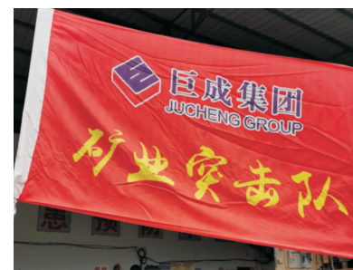
突击任务做先锋,立足岗位创佳绩;攻坚克难敢拼搏,凝心聚力