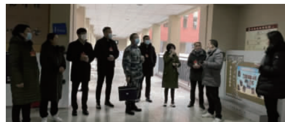
梯等地视察,现场听取了学校、住建委相关负责人的介绍。视察中,代表们对2020年民生实事取得的成效表示了充分的肯定。同时表示,将积极发挥人大代表职责作用,围绕全区发展实际,履职尽责,建言献策,形成书面材料呈交区人大,努力推动全区经济社会发展。