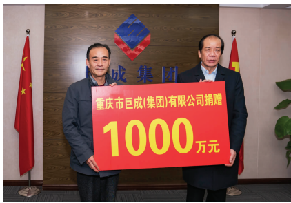
本报讯 近日,重庆市巨成(集团)有限公司在重庆市慈善总会捐赠1000万元设立“重庆巨成集团慈善基金”并举行捐赠仪式。